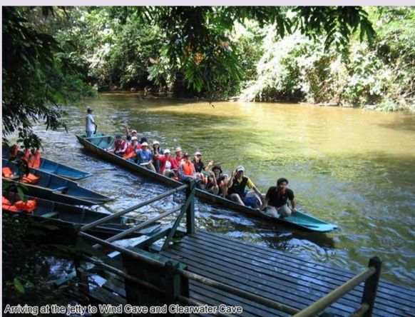
Arriving at the Jetty to Wind Cave and Clearwater Cave